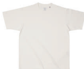
02 NTR ナチュラル