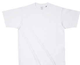
01 WHT ホワイト