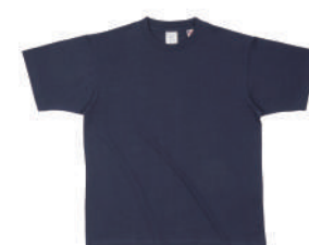
69 Nvy ネイビー