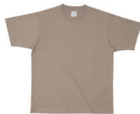
13 DSN ダルスサンド