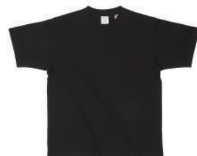
03 DBK ディープブラック