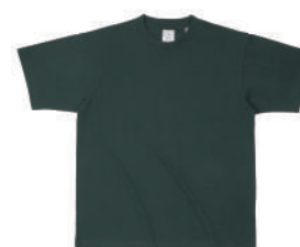
27 DGR Dグリーン