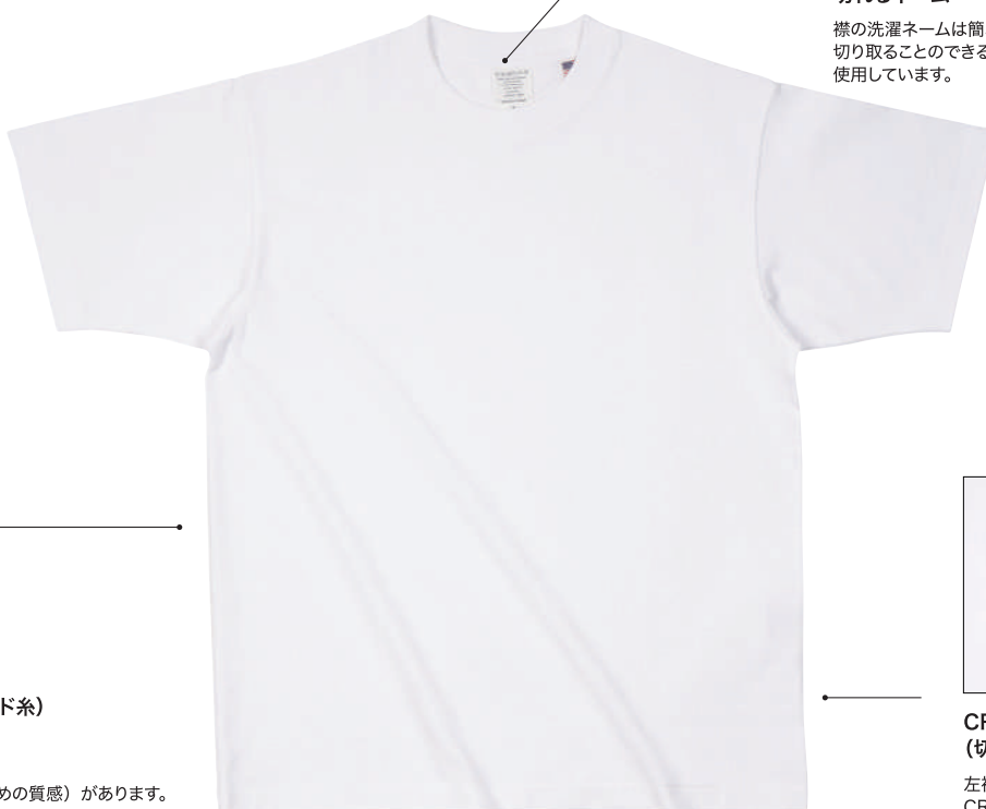
01 WHT ホワイト