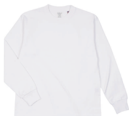
01 WHT ホワイト