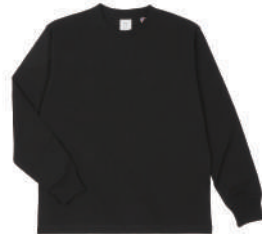
03 DBK ディープブラック