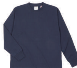
69 NVY ネイビー