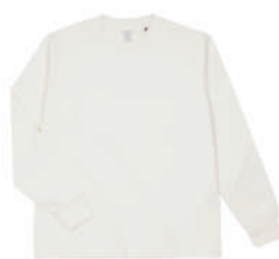
02 NTR ナチュラル