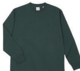
27 DGR Dグリーン