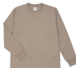
13 DSN ダルサンド