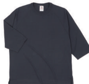
69 NVY ネイビー