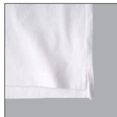
前後段違い仕様の 裾スリット