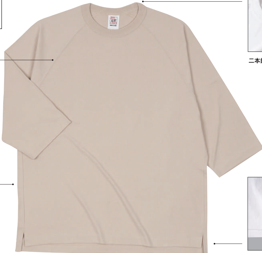
14 STN ストーン