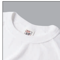
二本針バインダー仕様

オープンエンドの糸は ふっくらとしており ボリュームがある一方で、 ドライでザックリとした風合いです。