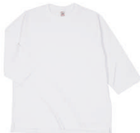
01 WHT ホワイト