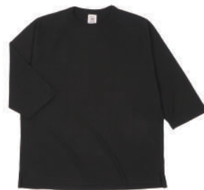
03 DBK ディープブラック