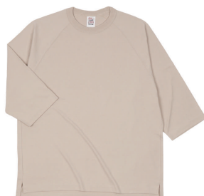
14 STN ストーン